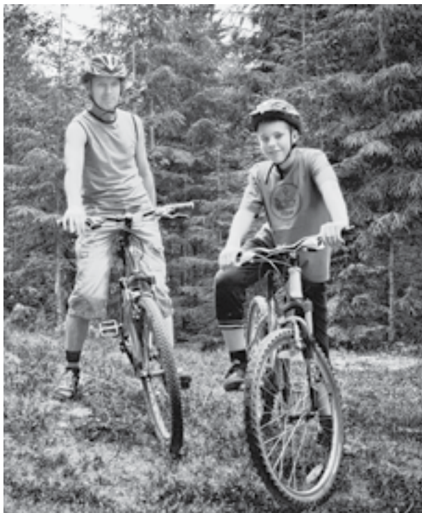
● Популярні у Ворохті і велопоїздки.

до вершини! – сказала. – Для першого і так багато переживань і краси.