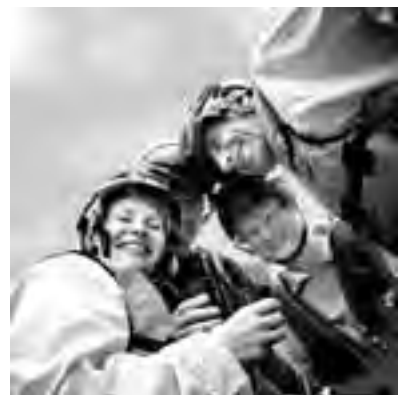
● Донеччани-криворіжці – за вдалим рафтингом.