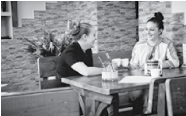
● Бесіда за кавусею.

Ця краса багато десятиліть надихає письменників і поетів, тим більше, що озеро оповите численними легендами. Одна з них – про дівчину Синь і хлопця Вира, які покохали одне одного, але їхнє кохання трагічно обірвалось. Вир загинув, а із сліз Сині, що побивалась за ним, утворилось чудове озеро, назва якого походить від імен цих закоханих. Тепер фігури Сині і Вира, вирізані з дерева, стоять на березі озера і віддзеркалюють свої постаті в його чистій і прозорій воді. До речі, максимальна глибина природної водойми – 22 метри. Її поверхня гладенька і спокійна, лише невеличкий острівця, площею всього декілька ме-