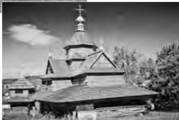
● Головний скарб Ворохти: ідеальна за пропорціями, дерев'яна церква без єдиного цвяшка, перевезена в 1780 р. з Яблуниці.

– Гірське мальовниче селище Ворохта сьогодні