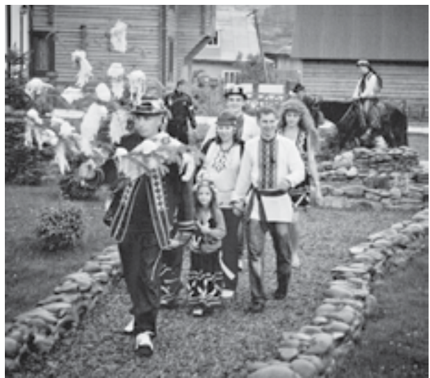
● Криворіжці були сватами на гуцульському весіллі.

ка – не лише символ життя, добра, надії, це ще й магичний оберіг нації, її філософії та культури, езотеричний зміст якої нині важко досягнути. Своїми витоками писанкарство сягає сивої давнини та відбиває уявлення наших предків про навколишній світ. Таємниця яйця – зародка життя, як і таємниця світового дерева, тисячоліттями викликала найрізноманітніші асоціації, була одним з найбільших див для людей в усі часи.