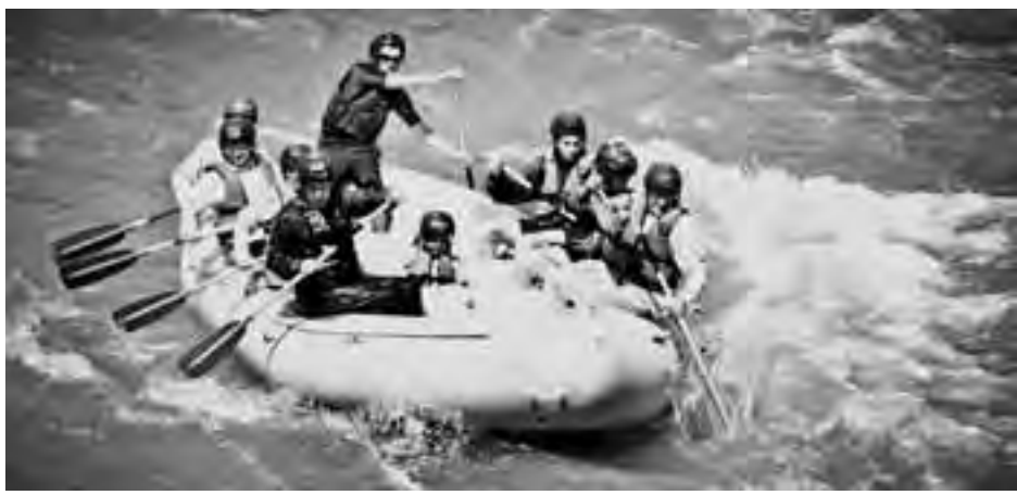
● Перед першим порогом на Чорному Черемоші.