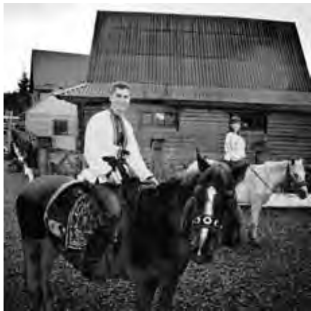
● Гуцул на коні – двічі гуцул.

Разом з чималим криворізьким десантом відпочивальників справжню гостинність приймаючої сторони почав відчувати вже на пероні залізничного вокзалу Тернополя. Зустрів нас ерудований екскурсовод Костя і одразу ж запропонував пішу подорож бруківкою по світлому, затишному місту. Перед нами відчинилися краєзнавчі